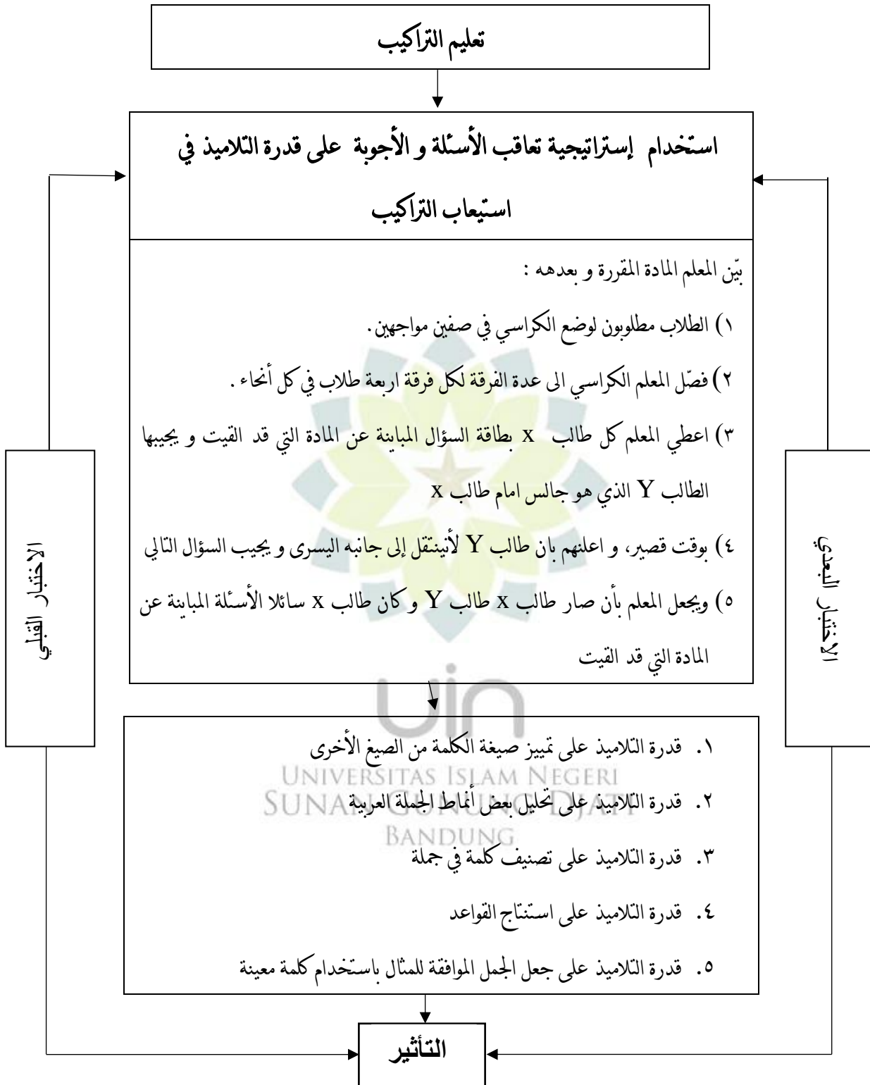
الصورة ١.١ أساس تفكير البحث