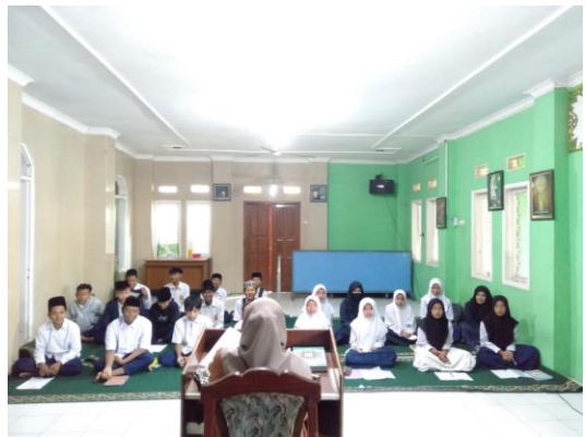
Guru memulai pembelajaran bahasa Arab dengan berdoa bersama dilanjutkan dengan mengabsen siswa dan menjelaskan kepada siswa bagaimana proses pembelajaran bahasa Arab menggunakan metode Bermain Peran.