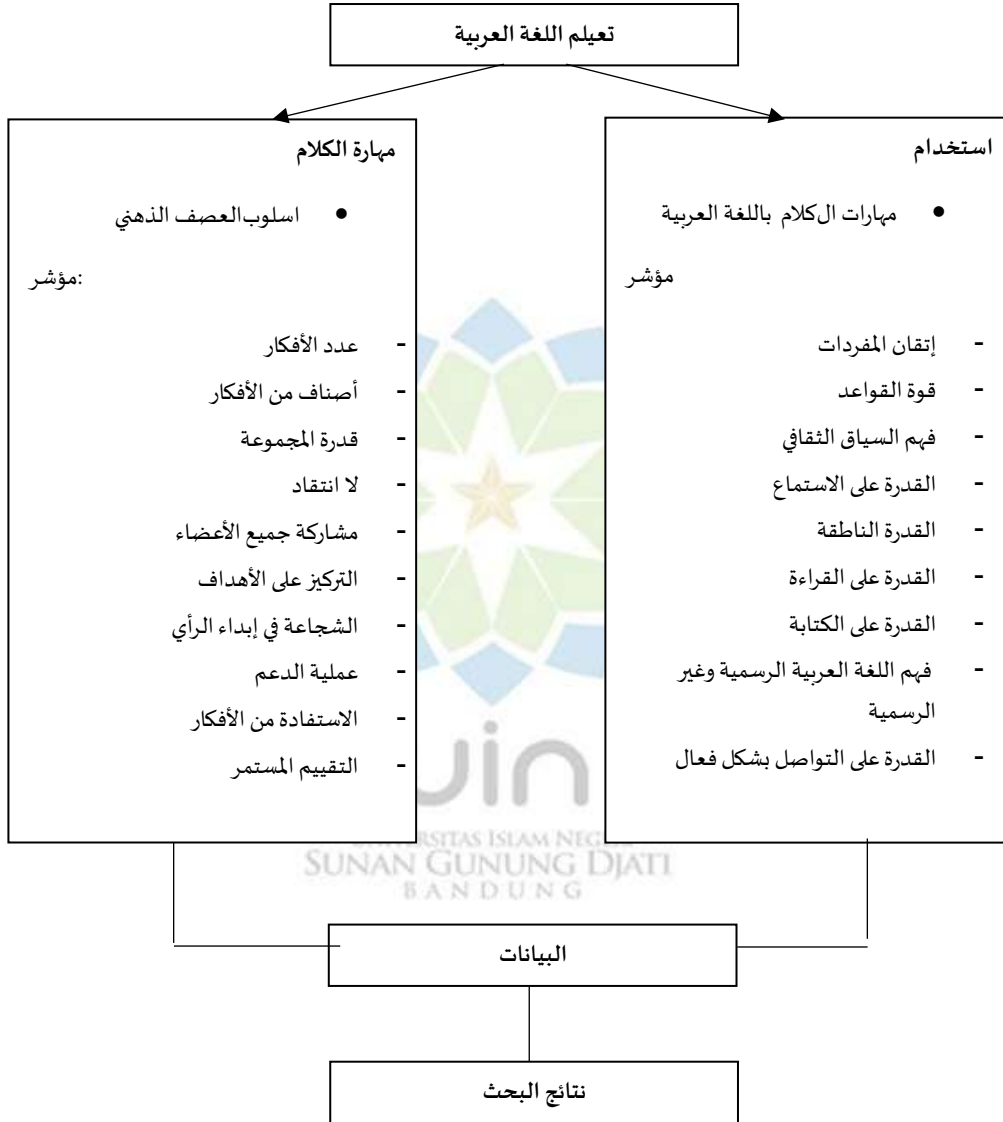
الصورة 1.2 اساس تفكير البحث

عشر، يتم تصنيف الطلاب على أنهم جاهزون. ومن ثم، ومن هذا الإطار الفكري، يمكن رؤية المؤشرات الخاصة بكل متغير على النحو التالي: