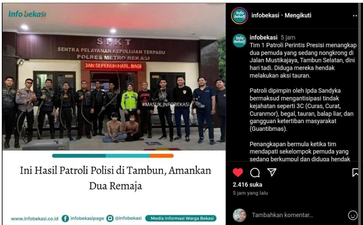
Gambar 1.1 Patroli Polisi Tambun Yang Diberitakan @infobekasi