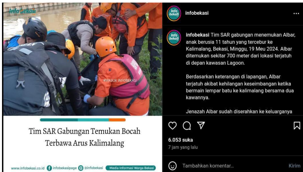
Gambar 1.2 Tim Sar Menemukan Anak Terbawa Arus Kalimalang

berita bahwa Tim SAR gabungan berhasil menemukan anak yang terbawa arus kalimalang, Bekasi.