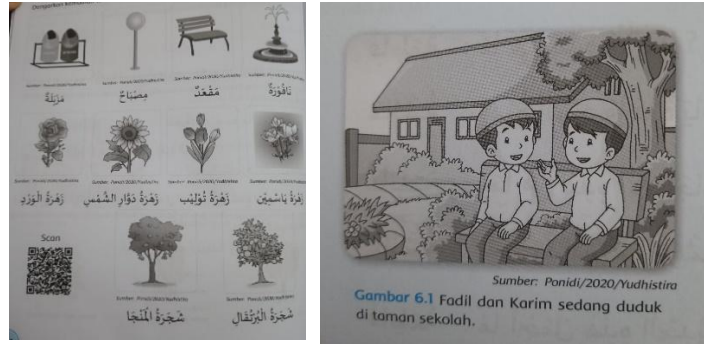
الصورة 1 توضيح داخلي عن مادة الحديقة

استنادًا إلى نتيجة الملاحظة الأولية لأحد كتب تعليم اللغة العربية المبنية على المنهج المستقلّي، يمكن تحديد إشكالية أساسية هي أن هذا الكتاب لم يدرج القيم التربوية الأخلاقية بشكل متوازن. وعلى الرغم من أن بعض المحتويات قد يكون لها تأثير على تشكيل شخصية الطلاب، إلا أن هذا التأثير ضئيل من حيث التكرار والكمية. بناءً على ذلك، يمكن تصنيف القيم التربوية الأخلاقية في هذا الكتاب إلى نوعين هما القيم المتضمنة (Inclusion) التي هي القيم التي تم إدراجها ضمن المادة التعليمية، سواء بشكل صريح أو ضمني. والقيم المقصنة (Exclusion) وهي القيم التي لم يتم إدراجها في المادة التعليمية. لفهم ظاهرة تضمين القيم التربوية الأخلاقية وإقصائها في هذه الكتب، يكون المنهج البحثي المناسب لهذه المشكلة هو المنهج النوعي باستخدام أسلوب تحليل الخطاب النقدي (Critical Discourse Analysis). ومن بين الأنواع المختلفة لـ CDA، فإن التحليل الذي طوره ثيو فان ليوين يُعتبر الأكثر ملاءمة لاستكشاف هذه القضية، حيث يتيح الكشف عن الآليات التي يتم من خلالها تضمين القيم الأخلاقية أو إقصائها في المواد التعليمية لهذه الكتب.