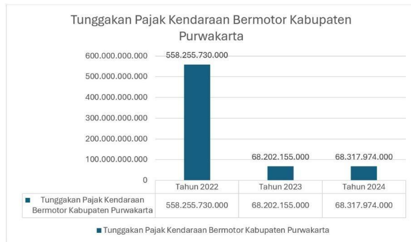
Gambar 1.2 Tunggakan Pajak Kendaraan Bermotor Kabupaten Purwakarta

Selain berdampak pada kepatuhan administratif, lemahnya komunikasi juga menghasilkan konsekuensi fiskal berupa hilangnya potensi penerimaan daerah. Untuk memperdalam analisis tersebut, berikut ditampilkan data besaran nilai tunggakan PKB: Tunggakan Pajak Kendaraan Bermotor Kabupaten Purwakarta