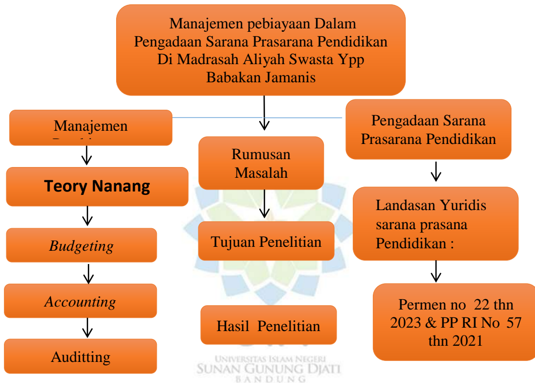
Gambar 1.1 Kerangka berfikir 1

penjelasan diatas kerangka berpikir dalam penelitian ini digambarkan sebagai berikut :