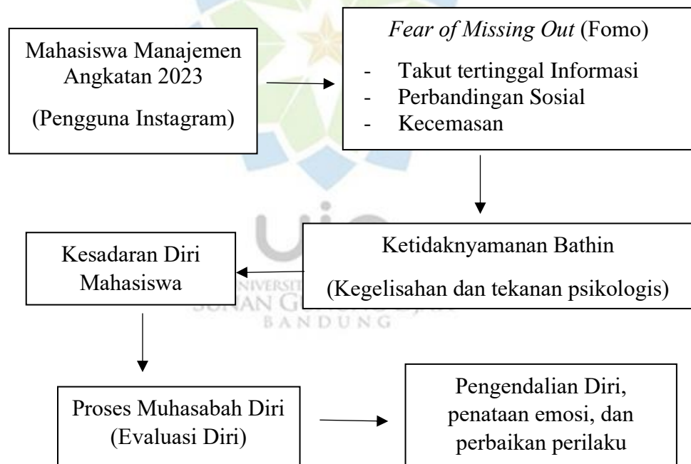
Gambar 1.1. Kerangka Berpikir

Berdasarkan teori dan temuan di atas, hubungan antara FoMO dengan muhasabah diri dapat dipahami sebagai hubungan yang terbentuk dari interaksi antara tekanan sosial digital dan mekanisme introspeksi religius. FoMO akibat penggunaan Instagram dapat meningkatkan kecemasan dan perbandingan sosial pada mahasiswa, sementara muhasabah berfungsi sebagai sarana pengendalian diri, penataan emosi, dan perbaikan perilaku. Dengan demikian, FoMO pada mahasiswa pengguna Instagram memungkinkan dapat menjadi faktor yang mendorong perlunya muhasabah diri sebagai bentuk regulasi diri dalam menghadapi tekanan sosial media. Untuk mempermudah memahaminya maka peneliti membuat kerangka pemikiran sebagai berikut: