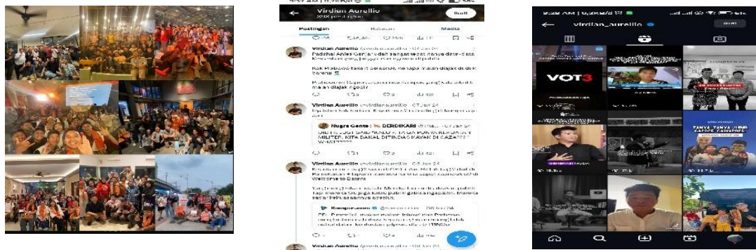
Gambar 1. 1 Unggahan Influencer viridian aurellio di media sosial instagram, tiktok, dan x

Penelitian ini berangkat dari asumsi bahwa peran influencer politik tidak hanya sekadar menyampaikan informasi, tetapi juga dapat mengarahkan preferensi politik pemilih muda melalui interaksi, konten, dan kredibilitas personal. Fokus penelitian ini adalah mengkaji bagaimana pengaruh Viridian Aurellio membentuk preferensi politik anggota Komunitas partisipatif indonesia menjelang Pemilu 2024. Perubahan cara komunikasi politik di era digital tidak hanya terjadi pada aktor politik formal, tetapi juga melibatkan individu non-politik seperti. influencer memanfaatkan media sosial sebagai alat untuk menyampaikan pesan politik yang lebih ringan, mudah dipahami, dan menjangkau khalayak luas, terutama generasi muda. Hal ini menjadikan mereka bagian dari strategi komunikasi politik modern yang efektif. Suatu bentuk fenomena yang akan ditampilkan melalui gambar berikut menunjukkan bagaimana turut berperan dalam membentuk preferensi politik masyarakat, khususnya pada komunitas partisipatif indonesia yang cenderung aktif dalam ruang digital dan lebih responsif terhadap pendekatan komunikasi yang bersifat personal.