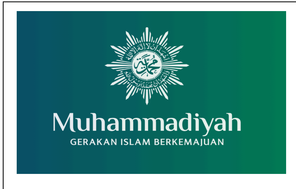
Gambar 1. 7 Logo Portal Resmi Muhammadiyah.or.id

Portal Muhammadiyah.or.id adalah media digital resmi milik Persyarikatan Muhammadiyah, organisasi Islam modernis terbesar di Indonesia yang dikenal dengan gerakan dakwah amar ma'ruf nahi munkar . Berpusat di Jalan Cik Ditiro No. 23, Yogyakarta, portal ini berfungsi sebagai representasi dari visi Muhammadiyah dalam memajukan peradaban umat melalui literasi dan amal nyata. Dengan basis anggota yang diprediksi mencapai 30 hingga 40 juta jiwa, portal ini menjadi pusat rujukan informasi bagi anggota persyarikatan maupun publik internasional melalui jaringan Cabang Istimewa di luar negeri. 112