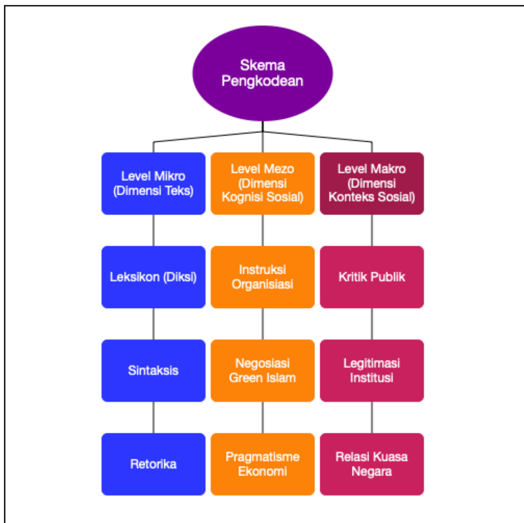
Gambar 1. 5 Skema Pengkodean