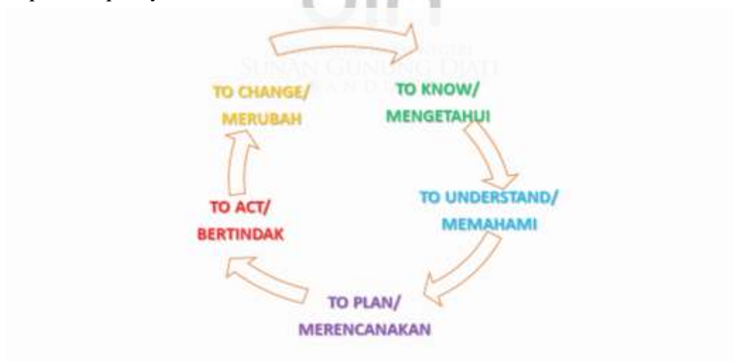
Gambar 1. 2 Tahapan Participatory Action Research (PAR)

Tahapan Participatory Action Research (PAR) dalam penelitian ini mengacu pada konsep yang dijelaskan dalam buku Metodologi Pengabdian kepada Masyarakat karya Affandi, et al. , (2022) yang menekankan keterlibatan aktif masyarakat dalam setiap proses penelitian, mulai dari perencanaan hingga refleksi. Adapun tahapannya