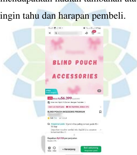
Gambar 1.1 Blind pouch Pada Etalase TikTok

Strategi pemasaran blind pouch terbukti efektif karena mampu memadukan unsur hiburan dan kejutan dalam satu produk. Konsep blind pouch sendiri adalah menjual barang dalam kemasan tertutup, sehingga pembeli tidak mengetahui isi pastinya hingga dibuka. Hal ini menciptakan sensasi penasaran dan ketidakpastian yang membuat konsumen terdorong untuk membeli secara spontan atau impulsif, meskipun sebelumnya tidak berniat membeli. Unsur kejutan ini menjadi daya tarik tersendiri, apalagi jika dalam kemasan tersebut disisipkan peluang mendapatkan hadiah tambahan atau item langka, sehingga meningkatkan rasa ingin tahu dan harapan pembeli.