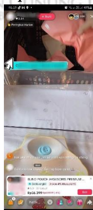
Gambar 1.2 Momen Unboxing Blind pouch Saat Live Streaming di TikTok.

Di TikTok, banyak penjual memanfaatkan blind pouch sebagai strategi agar pembeli tertarik, baik melalui siaran langsung maupun tampilan produk di