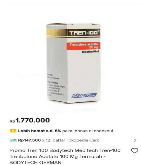
Gambar 1.1 Produk Anabolik Steroid ( Trenbolone Acetate )

Salah satu obat yang diperjualbelikan secara digital berdasarkan gambar 1.1 ada di aplikasi Tokopedia yaitu anabolik steroid ( Trenbolone Acetate ) termasuk ke dalam jenis obat yang dilarang diperjualbelikan secara bebas. Tetapi, bukan obat yang termasuk dalam kategori narkotika, melainkan masuk dalam kategori obat keras. 11 Secara umum anabolik steroid biasa digunakan untuk pengobatan medis ketika menghadapi pasien yang memiliki penyakit asma, radang rematik, dan pengobatan kanker. 12 Namun, pada prakteknya acap kali tidak digunakan oleh pasien yang memiliki penyakit yang disebutkan tadi, anabolik steroid di era sekarang kebanyakan sering digunakan sebagai PED (Performance Enhanced Drugs) , yaitu untuk meningkatkan performa kekuatan dan perolehan masa otot yang melebihi kapasitas manusia pada umumnya, yang mana sering dipakai oleh atlet binaraga untuk mengikuti body contest (kontes badan).