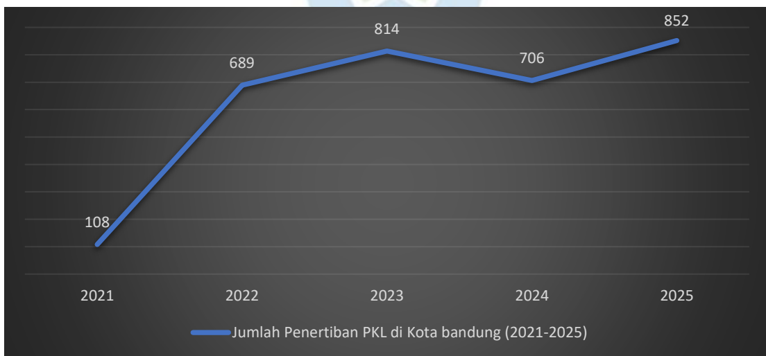
Gambar 1.1 Data Jumlah Penertiban PKL di Kota Bandung (2021-2025)

Sumber: Satuan Polisi Pamong Praja Kota Bandung, Diolah oleh Peneliti (2026).