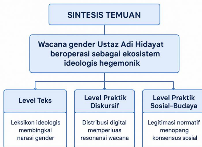
Figure 29 Sintesis Temuan

ekosistem ideologis hegemonik yang saling menguatkan. Di satu sisi, bahasa dan leksikon religius membentuk kerangka narasi yang memposisikan peran gender dalam perspektif tertentu. Di sisi lain, distribusi digital memastikan pesan ini menyebar luas dan resonansi di berbagai lapisan audiens, sementara legitimasi sosial-budaya mengukuhkannya sebagai norma yang dianggap alami. Skema berikut menggambarkan secara ringkas hubungan antara ketiga level analisis tersebut dan bagaimana masing-masing berkontribusi pada reproduksi wacana gender UAH.