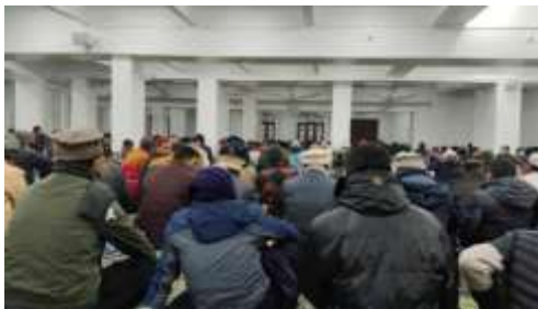
Suasana menjelang shalat subuh berjamaah