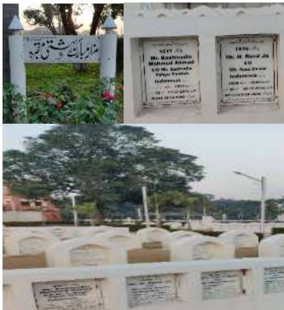
Tempat pemakaman Mirza Ghulam Ahmad bersama para mushi