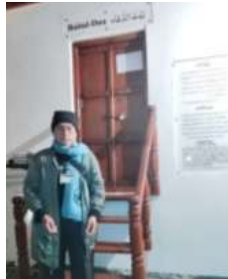
Tempat Mirza Ghulam Ahmad berdoa