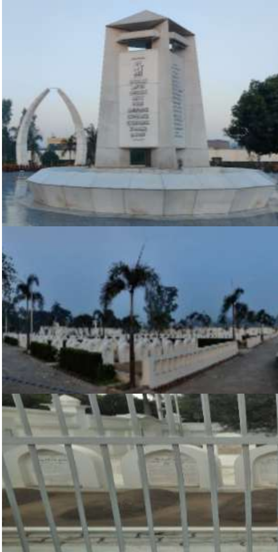
Suasana di Bahisti Maqbarah