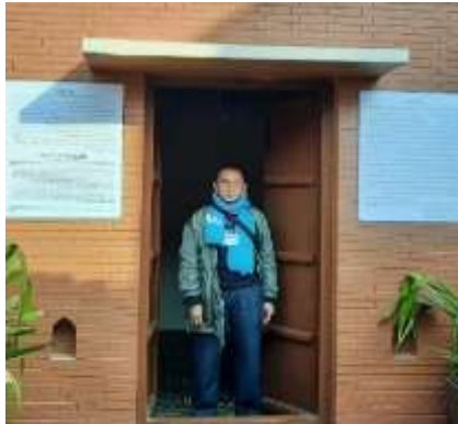
Tempat riyadhah ruhani Mirza Ghulam Ahmad