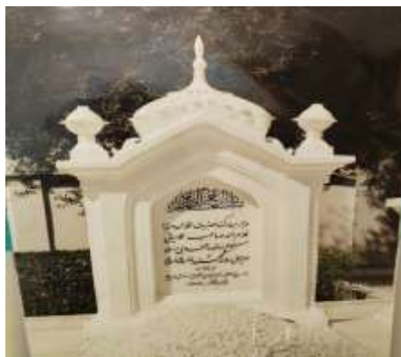
Makam Hazrat Mirza Ghulam Ahmad di Qadian