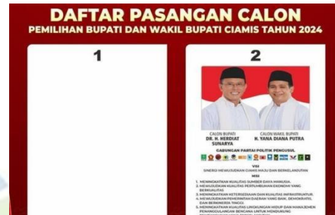
Gambar 1.2 Surat Suara

Berbeda dengan munculnya gerakan kotak kosong, yakni pilihan bagi pemilih untuk tidak memilih pasangan calon tunggal dan memberikan suara kepada kolom kosong yang disediakan oleh KPU. Di Kabupaten Ciamis, pada Pilkada Serentak 2024, terjadi fenomena calon tunggal yang memicu munculnya gerakan kotak kosong oleh sekelompok masyarakat yang tidak sepakat dengan dominasi satu calon. Gerakan ini menjadi bentuk ekspresi politik rakyat yang merasa kehilangan pilihan dan ruang alternatif dalam kontestasi elektoral. Namun, gerakan kotak kosong juga menyiratkan adanya ketidakpercayaan masyarakat terhadap partai politik, proses seleksi calon, serta lemahnya pendidikan politik di tingkat lokal.