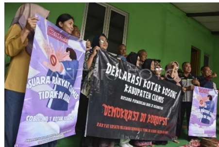
Gambar 1.1 Gerakan Kotak Kosong

cukup kuat untuk mendorong perubahan struktural. Di sisi lain, lemahnya fungsi partai politik dalam menjalankan perannya sebagai wahana rekrutmen politik dan pendidikan politik juga menjadi akar persoalan munculnya calon tunggal dan minimnya partisipasi alternatif dari masyarakat sipil.