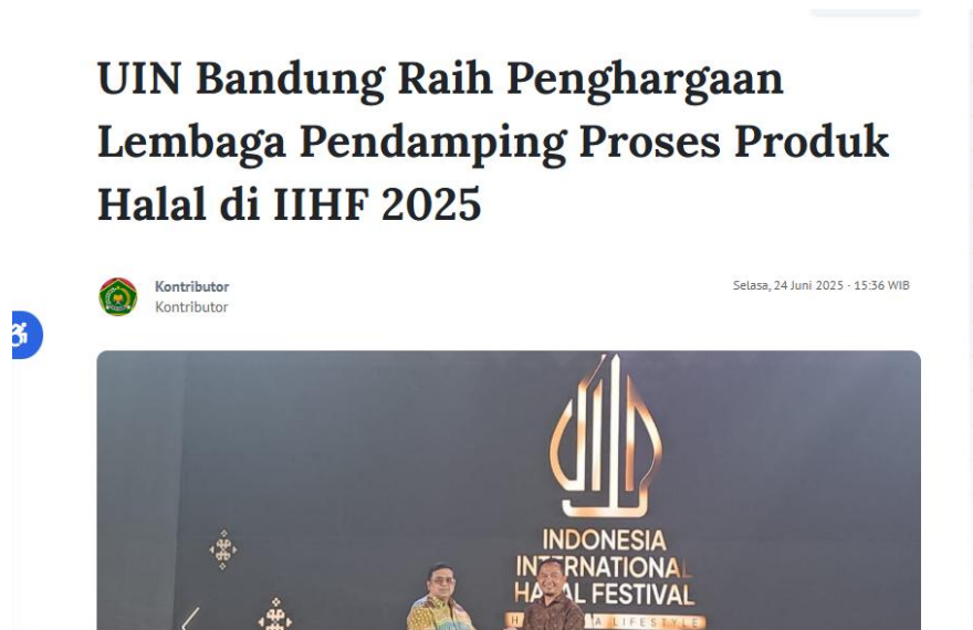
Gambar 1. 3 LP3H UIN Bandung meraih Penghargaan di IIHF 2025