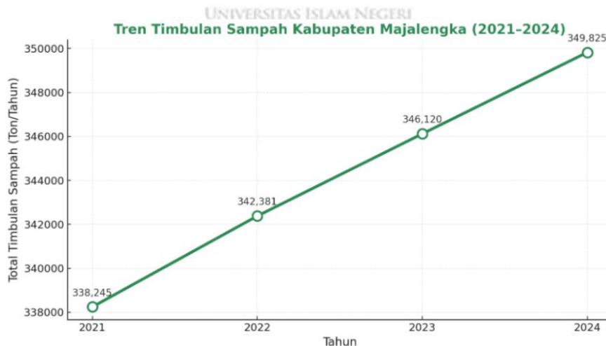
Gambar 1.1 Timbulan Sampah Kabupaten Majalengka Tahun 2021-2024

Kondisi TPA Heuleut yang menampung volume sampah jauh melebihi daya tampung menunjukkan adanya fenomena overcapacity . Secara konseptual, kapasitas merupakan kemampuan maksimum suatu sistem dalam menampung beban atau menghasilkan output dalam periode tertentu (Heizer, Render, & Munson, 2019). Dengan demikian, overcapacity dapat dipahami sebagai kondisi ketika beban yang ditangani melebihi kapasitas maksimum yang tersedia. Dalam konteks pengelolaan sampah, kondisi ini terjadi ketika volume sampah yang masuk ke Tempat Pemrosesan Akhir (TPA) melampaui daya tampung lahan dan fasilitas yang ada.