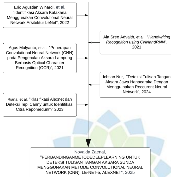
Gambar 1.1 Hubungan Penelitian