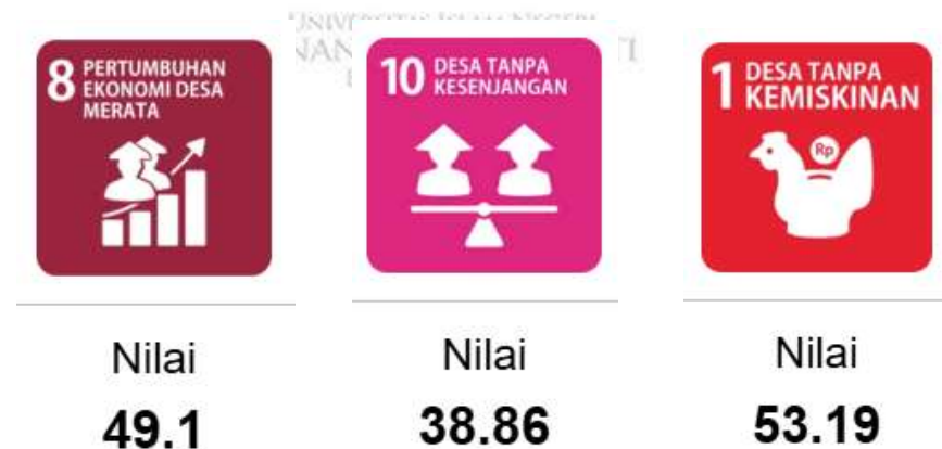
Gambar 1. 1 Data SDGs Cibiru Wetan

Hal ini terlihat dari data SDGs Desa Cibiru Wetan, yang menunjukkan bahwa persentase capaian indikator ekonomi, seperti pertumbuhan ekonomi desa merata, desa tanpa kesenjangan dan penurunan kemiskinan, masih tergolong rendah.