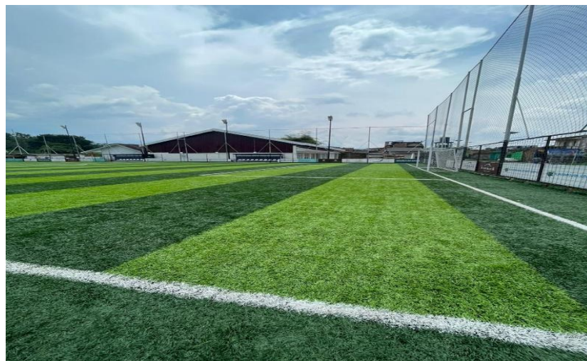
Gambar 1.1 Pembangunan Utama Desa Sukamenak Tahun 2023-2024

Salah satu program pembangunan utama di Desa Sukamenak pada tahun 2023-2024 adalah pembangunan GOR futsal yang direncanakan menjadi pusat aktivitas masyarakat dan dikelilingi UMKM milik warga sebagai simpul baru perekonomian desa. Program ini menunjukkan bagaimana APBDes digunakan untuk membangun infrastruktur sekaligus mendorong kesejahteraan melalui pemberdayaan ekonomi lokal.