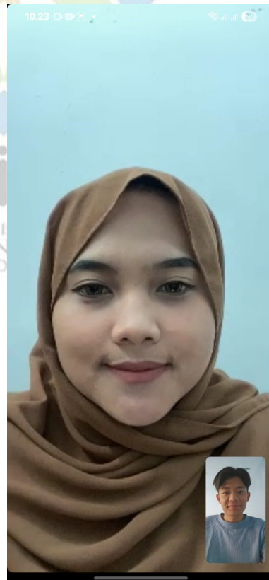
Lampiran 5. Dokumentasi Wawancara dengan Informan