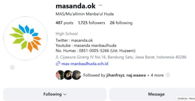
Gambar 2.2 Tampilan Feed Akun Insstagram MAS Manbaul Huda