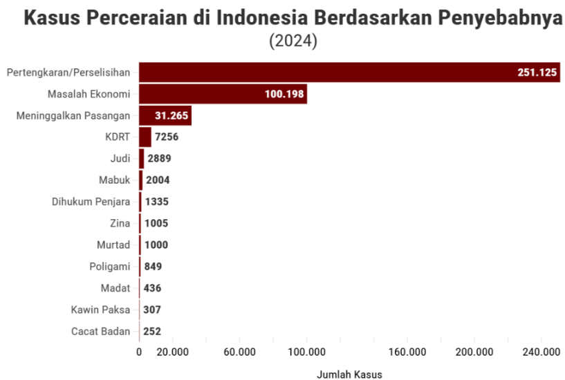
Gambar 1. 1