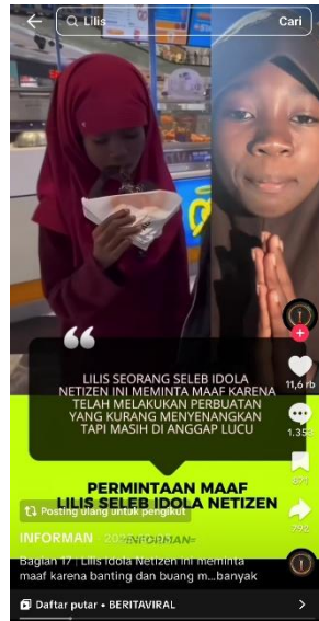
Gambar 1.1 konten approval seeking

Salah satu fenomena approval seeking TikTok yang terjadi di Indonesia yakni terdapat akun TikTok bernama @lilisswoyy yang mana salah satu kontennya diunggah bersama akun @mamiayuyu. Konten ini bisa dianalisis sebagai bentuk perilaku approval seeking di media sosial.