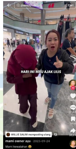
Gambar 1.2 konten approval seeking

Pada konten di atas menggambarkan dua individu yang tengah memakan roti dari Auntie Anne's, di mana salah satu individu tersebut membanting roti langsung di depan toko makanan yang berkaitan, dengan ungkapan "rasanya seperti aspal". Di sisi lain, atas tindakan tersebut membuat individu memberikan klarifikasi dan permohonan maaf yang mana tujuan pembuatan kontennya untuk menghibur para penonton di TikTok.