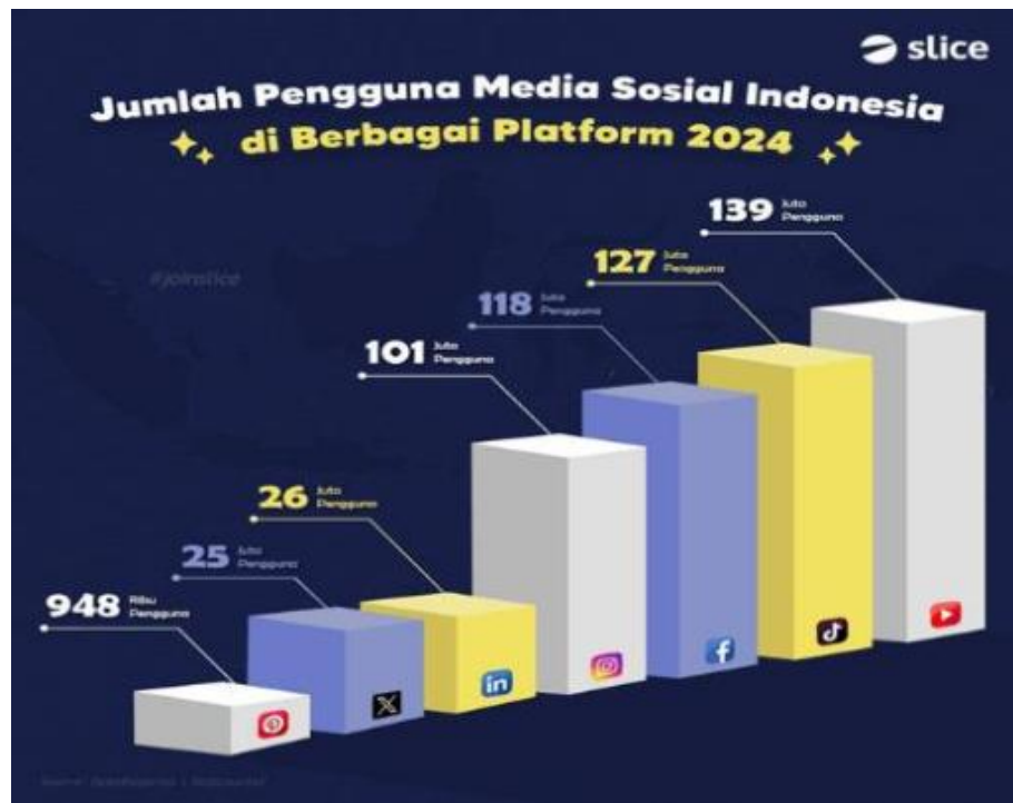
Gambar 1.2 Jumlah Pengguna Media Sosial Indonesia Tahun 2024

lebih interaktif, terbuka, dan terlibat. Menurut fenomena ini, media sosial telah berkembang dari hanya digunakan sebagai hiburan menjadi media digital untuk pendidikan dan literasi, termasuk membantu mahasiswa belajar.