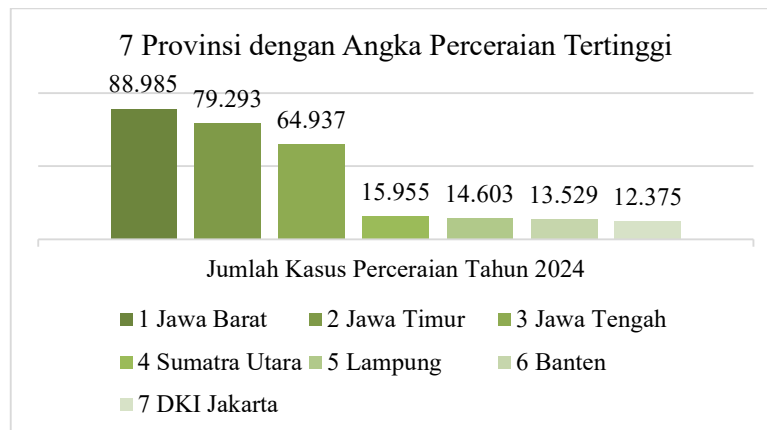
Gambar 1.1 Grafik Jumlah Kasus Perceraian Tahun 2024

Gambar 1.1 yang memuat data dari Badan Pusat Statistik (BPS) tahun 2024, menunjukkan bahwa Jawa Barat berada di urutan pertama sebagai provinsi dengan tingkat perceraian tertinggi di Indonesia, dengan 88.985 kasus. Selanjutnya, Jawa Timur menempati urutan kedua dengan 79.293 kasus, diikuti oleh Jawa Tengah dengan 64.937 kasus. Sementara itu, provinsi-provinsi lain seperti Sumatra Utara 15.955 kasus, Lampung 14.603 kasus, Banten 13.529 kasus, dan yang menempati posisi berikutnya yaitu DKI Jakarta dengan 12.375 kasus. 9