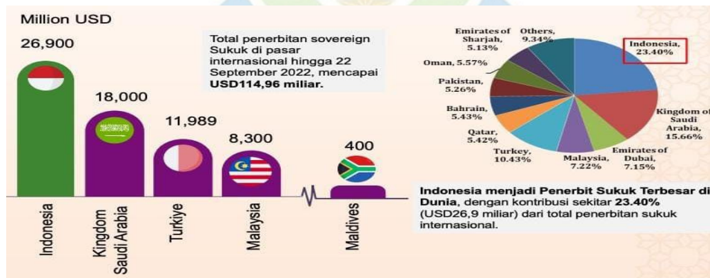
Gambar 1.1. Penerbitan Global Sukuk

Umat Islam sesungguhnya memiliki opsi lain untuk berwakaf secara produktif yang dapat dimanfaatkan sebagai jawaban atas tantangan pembiayaan infrastruktur, yaitu melalui skema Cash Waqf Linked Sukuk (CWLS). Instrumen ini dipandang mampu menyediakan sumber pendanaan yang berkelanjutan guna memenuhi kebutuhan pembangunan infrastruktur yang terus bertambah. Pemanfaatan CWLS tidak hanya diarahkan untuk mendukung pertumbuhan ekonomi, tetapi sekaligus menjadi medium pelaksanaan kewajiban keagamaan dalam bentuk pengeluaran dana sosial (amal). Dengan demikian, CWLS menggabungkan dimensi spiritual dan tujuan pembangunan dalam satu mekanisme yang berjalan secara bersamaan. 30