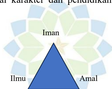
Gambar 1. 1 Integrasi antara Iman, Ilmu, dan Amal

spiritualitas siswa. Seperti disebutkan dalam surat Q.S. Al-Mujadilah ayat 11 bahwa pentingnya pengamalan ilmu dalam kehidupan sehari-hari untuk membangun karakter berakhlak mulia. Selain itu, Imam al-Ghazali menjelaskan tentang konsep iman didasarkan pada tafsir ayat Qur'an dari surah Al-Baqarah ayat 177, 257, dan Ibrahim ayat 27 ditegaskan bahwa iman mempengaruhi nilai karakter dan pendidikan Islam 14 . Berikut ilustrasinya: