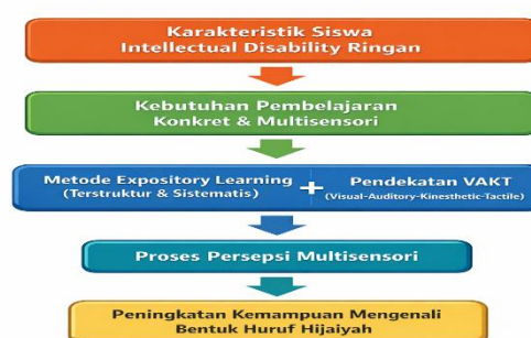
Gambar 1.1 Pendekatan Pembelajaran Huruf Hijaiyyah

Urgensi praktisnya terletak pada kebutuhan nyata untuk meningkatkan kemampuan literasi Al-Qur'an bagi siswa dengan hambatan intelektual ringan. Kemampuan mengenali huruf hijaiyah merupakan fondasi pembelajaran agama Islam yang tidak dapat diabaikan. Pendidikan inklusif menuntut agar setiap siswa memperoleh akses pembelajaran yang sesuai dengan kemampuannya.