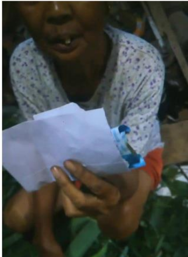
Gambar 3 Kasus viral politik uang di Kecamatan Cihampelas

Tingginya tingkat kemiskinan di Kecamatan Cihampelas, sebagaimana telah dijelaskan melalui data sebaran penduduk miskin serta keterbatasan akses pendidikan dan layanan kesehatan, menunjukkan adanya kerentanan sosial yang signifikan. Kondisi ini berpotensi dimanfaatkan dalam strategi elektoral, terutama pada Pemilu 2024, ketika praktik politik uang dijadikan sebagai instrumen untuk memperoleh dukungan suara oleh sebagian kandidat.