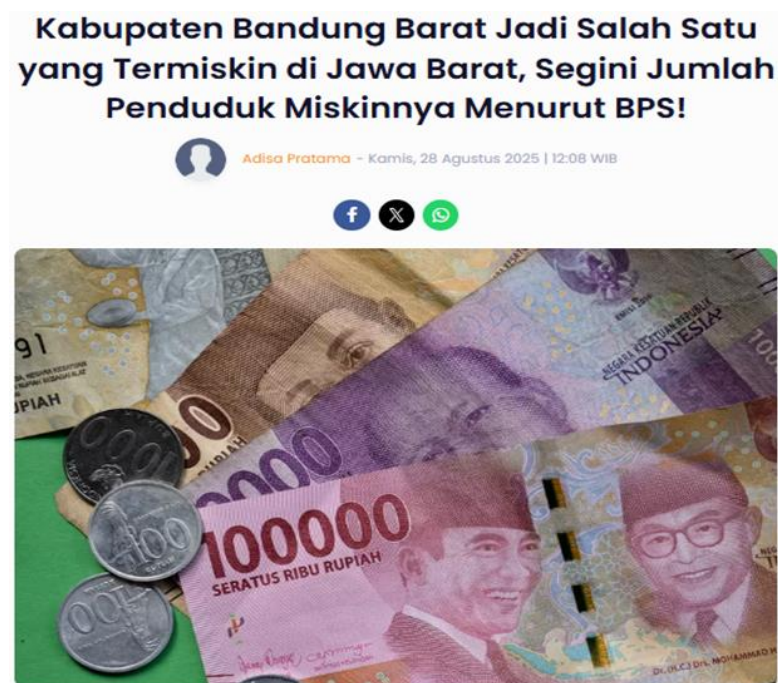
Gambar 2 Data Badan Pusat Statistik Mengenai Tingkat Kemiskinan Kabupaten Bandung Barat

baik dalam hal kesejahteraan ekonomi, akses terhadap informasi politik yang memadai, maupun kesadaran akan pentingnya integritas dalam proses demokrasi (Yusuf et al., 2024). Dalam situasi seperti ini, tekanan ekonomi menjadi salah satu pendorong utama yang membuat sebagian masyarakat lebih mudah menerima imbalan materi sebagai kompensasi untuk dukungan politik