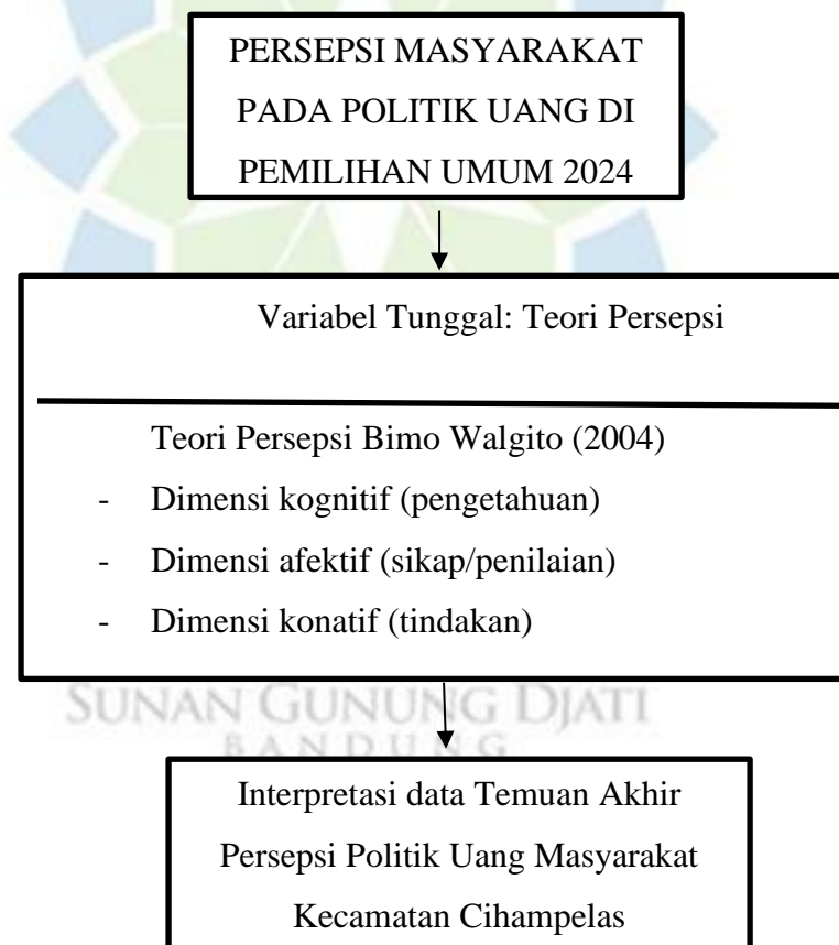
Bagan 1 Kerangka Berpikir

Melalui kerangka ini, penelitian bergerak dari fenomena objektif (kasus politik uang dan kondisi kemiskinan) menuju analisis subjektif (persepsi masyarakat). Tahap akhir dalam kerangka berpikir adalah interpretasi data temuan akhir, yang bertujuan menggambarkan secara empiris bagaimana persepsi politik uang terbentuk di Kecamatan Cihampelas. Dengan demikian, kerangka berpikir tersebut menunjukkan hubungan yang sistematis antara latar belakang masalah, teori yang digunakan, variabel penelitian, hingga pada analisis dan interpretasi hasil, sehingga penelitian tetap konsisten dan terarah sesuai fokus kajian.