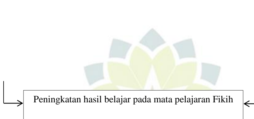
Gambar 1.1 Skema Kerangka Pemikiran