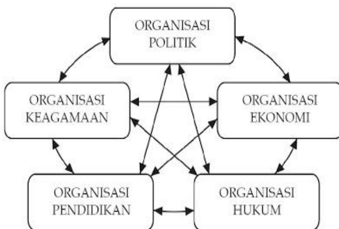
Gambar Bagan 1 keterkaitan Lembaga Kemasyarakatan

Saluran tersebut berfungsi agar sesuatu perubahan dikenal, diterima, diakui, serta dipergunakan oleh khalayak ramai, atau mengalami proses institutionalization (pelembagaan). Di bawah ini digambarkan bagan lembaga-lembaga kemasyarakatan sebagai sistem sosial sebagai berikut: