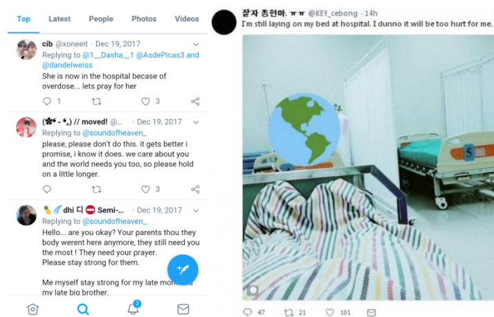
Gambar 1.2 Akun Twitter Shawol (Fans Shinee)