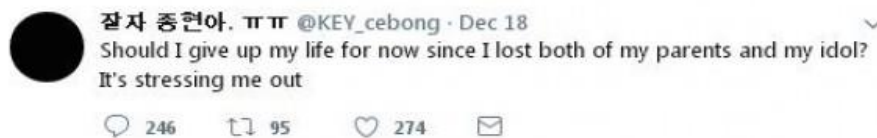
Gambar 1.1 Postingan Akun Shawol (Fans Shinee)