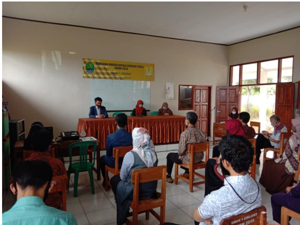
Gambar 7 Penutupan dengan Pihak Sekolah