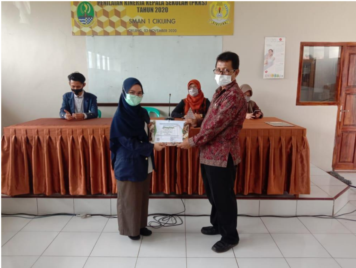
Gambar 8 Penyerahan Sertifikat Kepada Guru Pamong