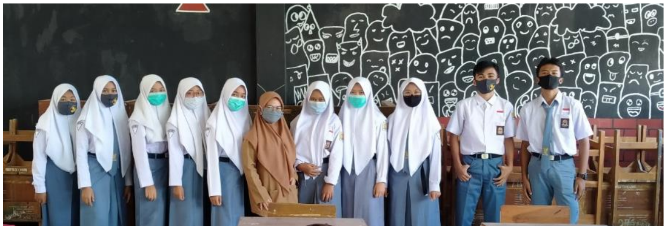
Gambar 5 Bersama Siswa/i Kelas X MIPA 3A