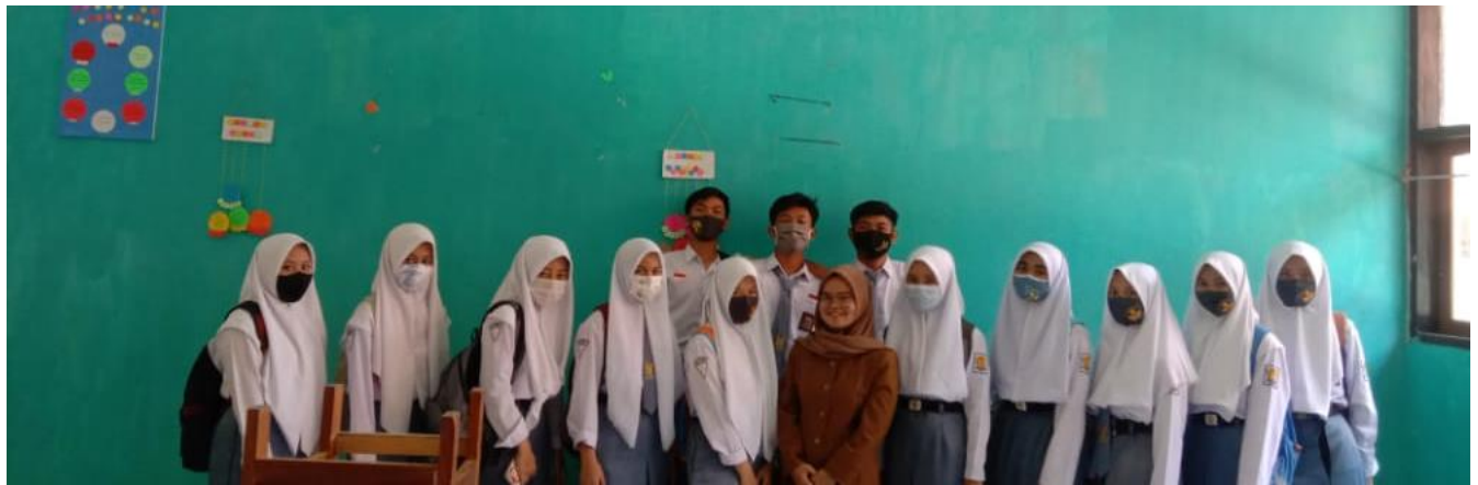
Gambar 4 Bersama Siswa/i Kelas X MIPA 2B