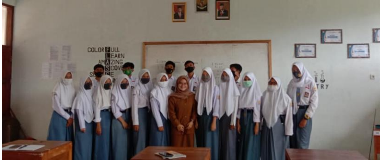
Gambar 3 Bersama Siswa/i Kelas X MIPA 1B