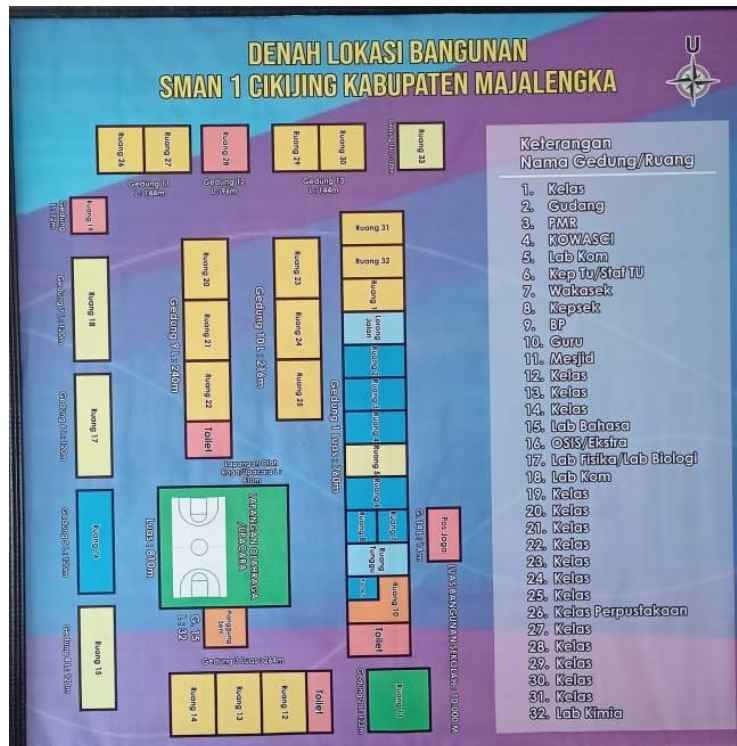
Gambar 2 Denah SMAN 1 Cikijing