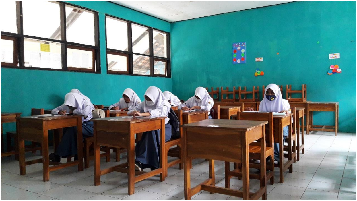
Gambar 10 Pelaksanaan Ngawas PAS