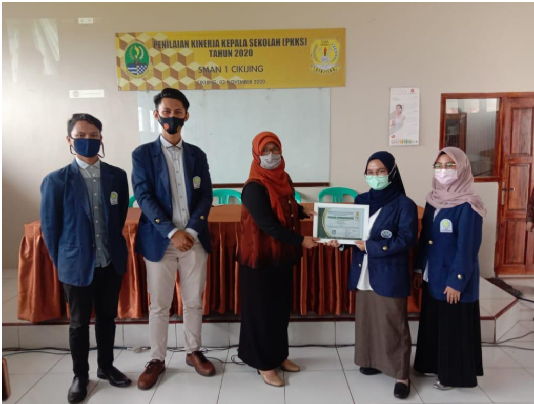
Gambar 6 Penyerahan Plakat dan Piagam Penghargaan Kepada Pihak Sekolah (Kepala Sekolah)