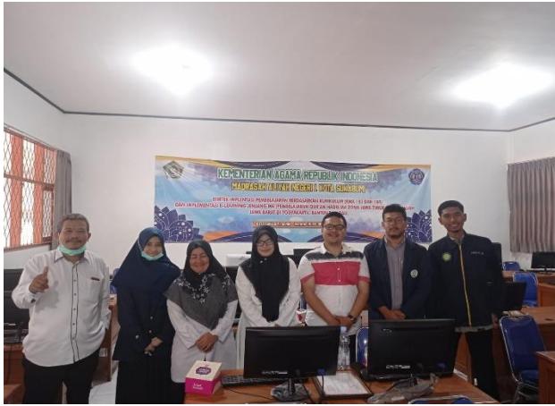
Foto Bersama Guru Pamong