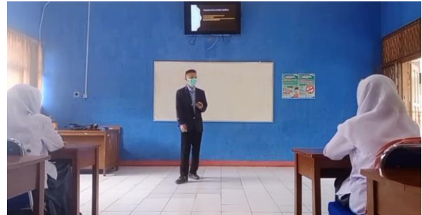
Pemutaran Bahan Ajar