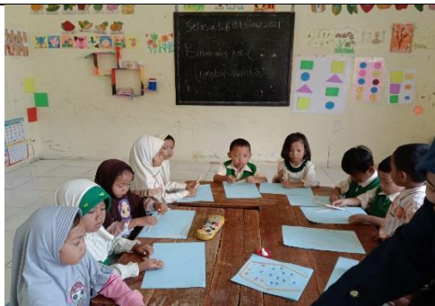
Pembelajaran di Kelas