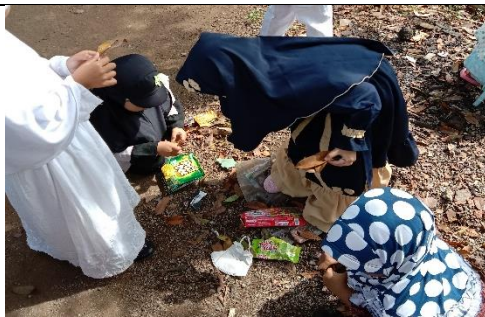
Kegiatan Mencari Daun di sekitar lingkungan sekolah