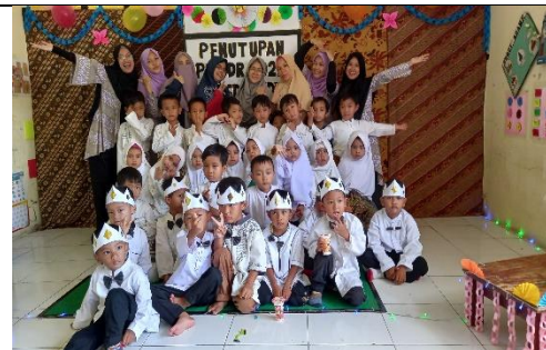
Foto Bersama RA PERSIS 99 Cibatu