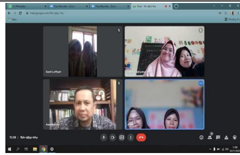
Refleksi Bersama DPL