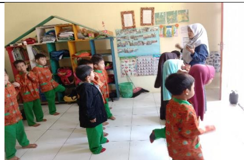
Kegiatan tari tradisional