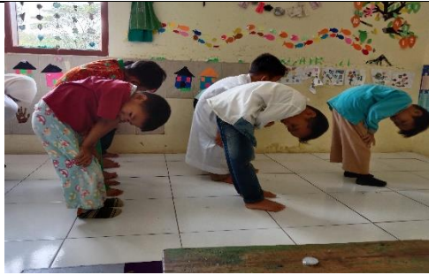
Kegiatan Sholat Duha