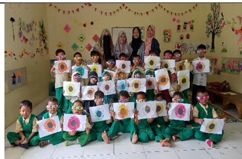
Kegiatan Membuat Kacamata Gerhana