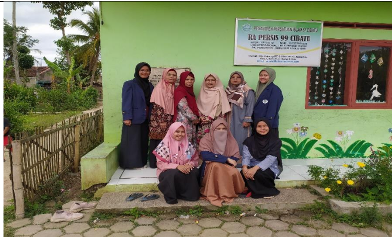
Foto bersama kepala sekolah dan guru RA PERSIS 99 Cibatu