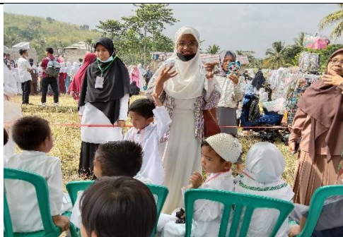
Kegiatan Manasik Haji