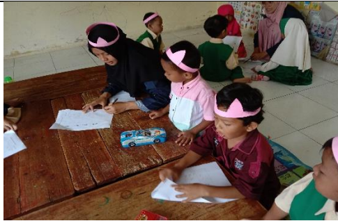
Kegiatan Membuat Bando Kelinci