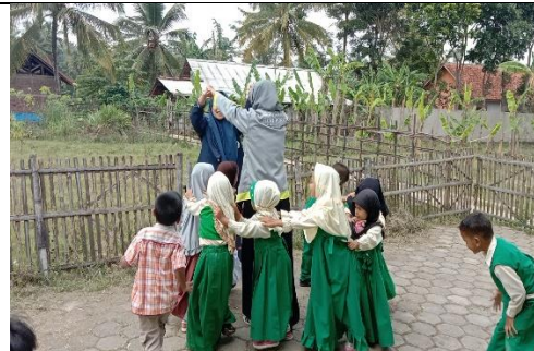
Main di Halaman Sekolah