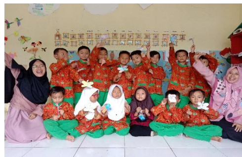
Kegiatan membuat kupu-kupu terbang