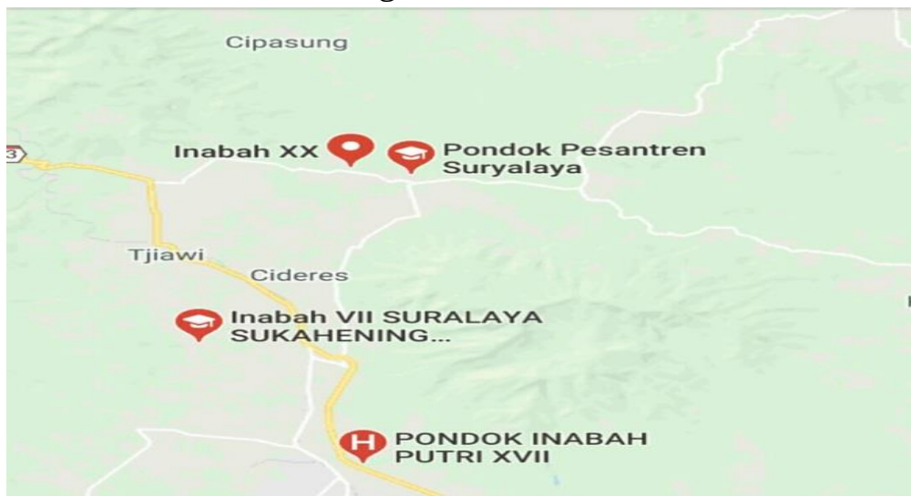
Gambar 1.1 Letak Geografis Inabah XX

Selain itu, dikembalikan ke citra diri pribadi melalui tiga fase penyadaran bagi manusia korban penyalahgunaan narkoba, yang masing-masing tingkatannya berlangsung selama 40 (empat puluh) hari pembinaan..