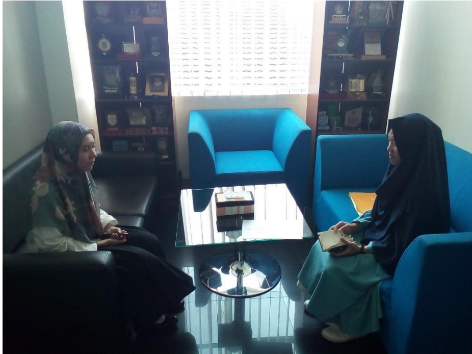
Proses Wawancara (Dinas DP3APM)