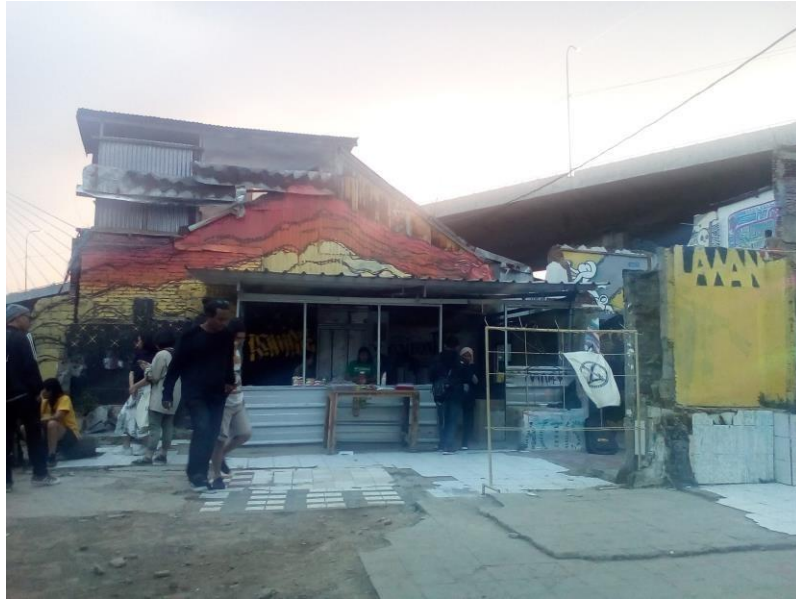
Dapur Tamansari (warung) dalam mengembangkan perekonomian warga