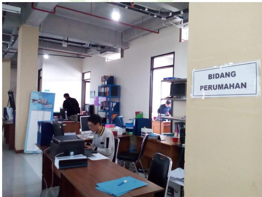
Ruang Bidang Perumahan DPKP3