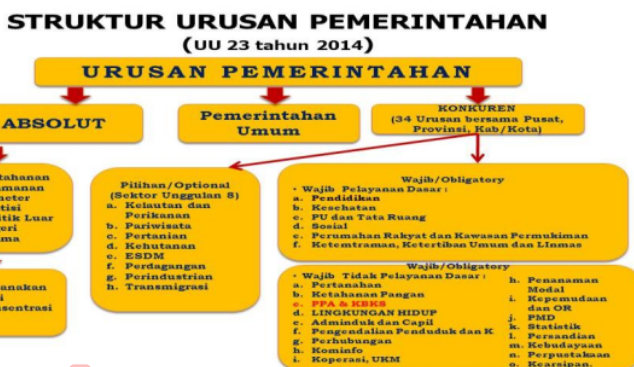
Gambar 1. Struktur Urusan Pemerintahan

Dari gambar tersebut nampak jelas bahwa pembagian urusan pemerintah dalam rangka dekonsentrasi dan tugas pembantuan adalah: (1) 6 (enam) urusan pemerintah pusat dapat didekonsentrasikan kepada perangkat pemerintah pusat atau wakil pemerintah pusat di daerah . Sedangkan urusan urusan konkuren pemerintah pusat didekonsentrasikan kepada Gubernur selaku wakil pemerintah pusat ; dan (2) 6 (enam) urusan pemerintah pusat dan urusan konkuren pemerintah pusat dapat ditugaskan pembantuan kepada daerah dan/atau desa. Hal ini nampak dalam urusan pendidikan yang merupakan pelayanan dasar yang menjadi urusan konkuren wajib, dimana pemerintah pusat memiliki kewenangan menetapkan standar nasional pendidikan dan pengelolaan pendidikan tinggi, pemerintah provinsi memiliki kewenangan mengelola pendidikan menengah dan mengelola pendidikan khusus, dan pemerintah kabupaten/kota memiliki kewenangan mengelola pendidikan dasar, mengelola pendidikan usia dini, dan mengelola pendidikan nonformal.