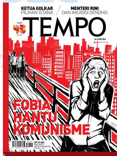
Gambar 1.1 Sampul Majalah Tempo Edisi 16-22 Mei 2016

Fenomena yang beredar dan seakan menghantui tersebut ternyata menjadi perhatian salah satu media Indonesia Tempo dalam sampul Majalah Berita yang berjudul “Fobia Hantu Komunisme”. 8 Sampul tersebut menampilkan sebuah ilustrasi karikatur yang memunculkan sosok mirip Presiden Indonesia Joko Widodo, dengan raut wajah yang menunjukkan ketakutan atau kepanikan. Secara keseluruhan sekilas gambar sampul tersebut mirip dengan lukisan karya Edvard Munch yang berjudul The Scream . Lukisan ini juga dianggap oleh banyak orang sebagai karya Edvard yang paling penting dan paling terkenal. 9