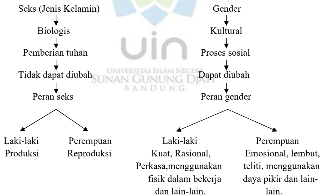
Gambar 1.1 Skema Pembeda antara Seks dan Gender

Gender dalam Bahasa Indonesia dipinjam dari Bahasa Inggris. Jika dilihat dari pemakaian kamus, sampai saat ini masih belum bisa dipisahkan mengenai pengertian gender dan sex . Menurut Mansour Fakih, gender adalah suatu sifat yang melekat pada kaum laki-laki dan perempuan yang dikonstruksi secara sosial maupun kultural. Misalnya bahwa perempuan itu dikenal lemah lembut, cantik, emosional atau keibuan. Sementara laki-laki dianggap kuat, rasional, jantan dan perkasa. 10