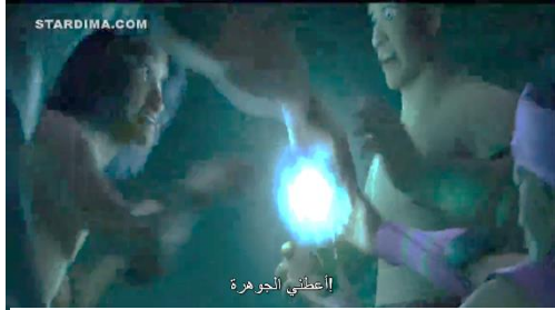
سورة ٤ . ١ مواطنو كومانديرا الذين خطفوا جواهر التنين لبعضهم البعض

وشكر رايا على إطلاعها على مكان تخزين أحجار التنين. وهذا يشمل المشاكل الاجتماعية أو المشاكل من العوامل النفسية. ومن المتوقع أن يؤدي ذلك إلى عواقب وخيمة على أن يكون هناك تعاون مع البلدان النامية (سويكانتو وسوليستيواي ، ٢٠١٣). حيث توجد خيانة لشخص ما