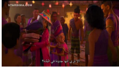
سورة ١١ . ١ أنقذ رئيس أرض المخالب سيسو من حصار مواطني أرض المخالب