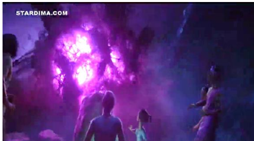
سورة ٧ . ١ هجوم دروون بعد كسر جوهرة التنين

تقديم مواطني كومانديرا الآخرين للم شملهم. لكن تم تجاهل العرض ، اختاروا القتال من أجل جوهرة