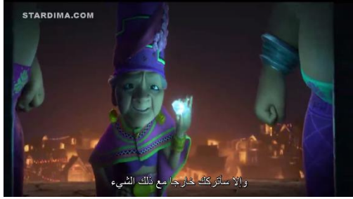
سورة ١٠ . ١ قام رئيس أرض المخالب بتأطير وتهديد سيسو

قبل الطفل من أرض المخالب. هذا المشهد هو واحد من المشاكل الاجتماعية للعوامل الثقافية.