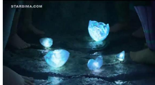
سورة ٦ . ١ جوهرة التنين المكسورة