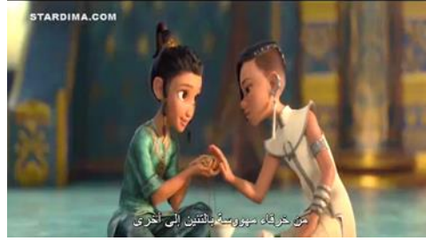
سورة ١.١ أعطت نمالي هدية الى ريا

نماري : " من خرقاء مهووسة بالثنين إلى أخرى "