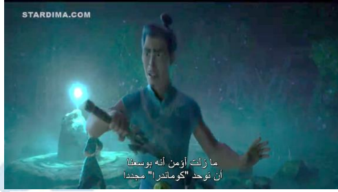
سورة ٥ . ١ يحاول بينجا إقناع سكان كومانديرا بلم شملهم