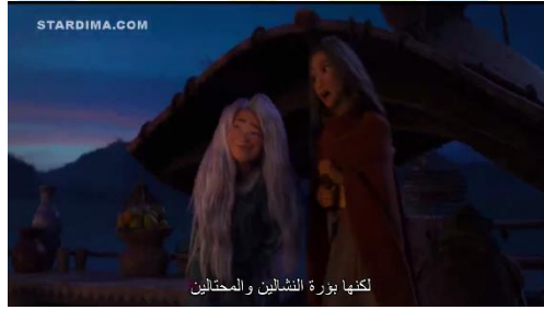
سورة ١ . ٩ رايا تشرح عادات مواطني مخالبا لسيسو

رايا : " لكنها بؤرة النشالين والمختالين "