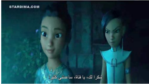
سورة ٣.١ خانت نماري الى ريا

ذهبية من الصداقة على شكل تينين لإحياء ذكراها كرميلة محبة للثنين.