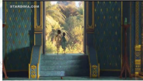
سورة ٢.١ ريا تأخذ نماري إلى قبو مجوهرات سيسو

نماري : " شكرا لك، يا فتاة، ساعدتني كثيرا "