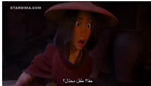
سورة ١ . ٨ المشهد عندما يتم سرقة جوهرة التنين